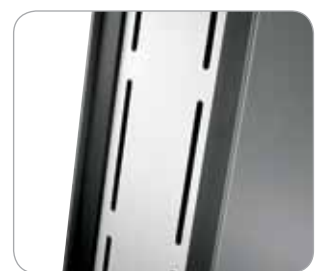
Belüftungsschlitze zum Staufach