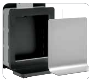
Einfach zu öffnendes Staufach