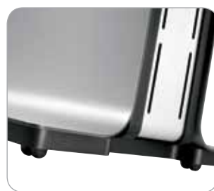
Integrierte Rollen zum einfachen Positionieren